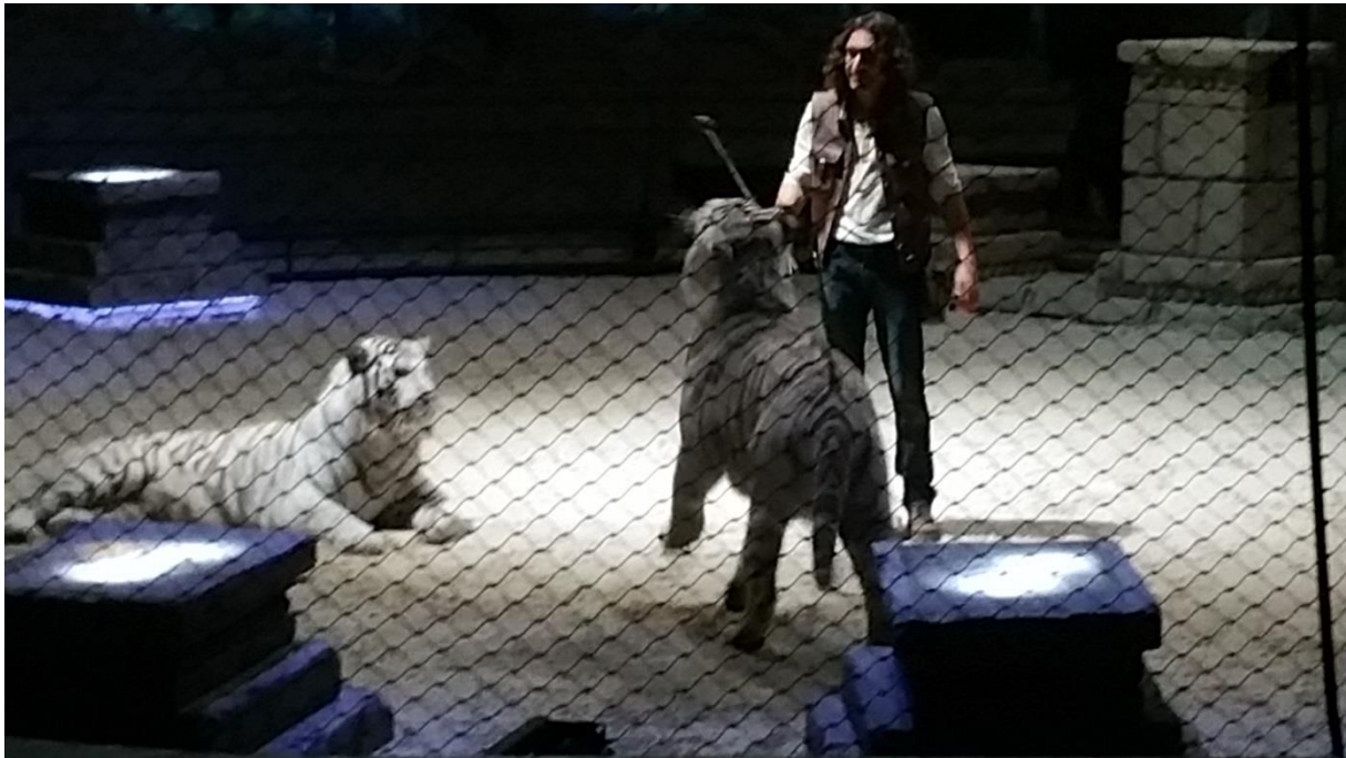
Tiger-world 2015