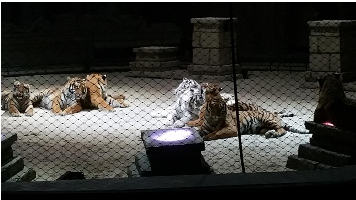
Tiger-world 2015 -Photos de Franck-Camille Monguillon pour Code Animal.